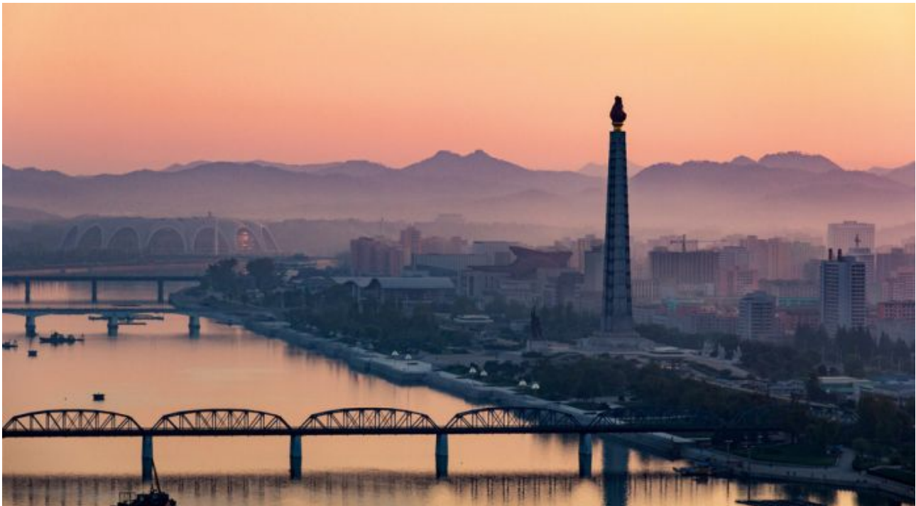
Nordkorea ist neu auch im Vögele-Rundreiseprogramm: Juche Turm in Pyöngyang.

Kunden können geführte Privatreisen schon ab zwei Teilnehmenden selber buchen.